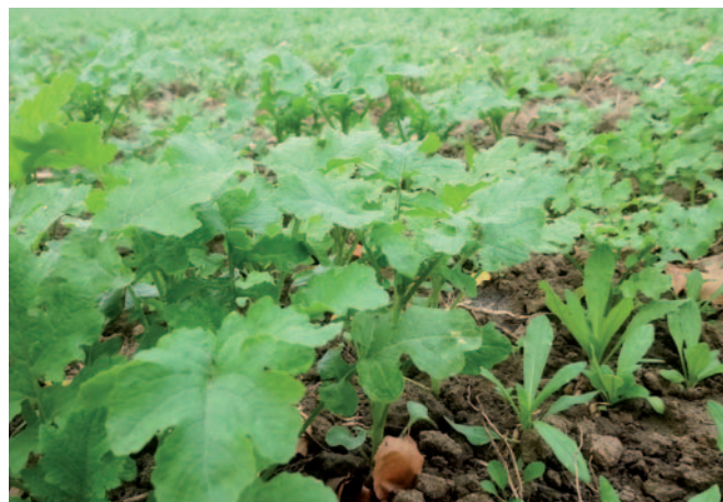
Detail rostliny lničky a hořčice 30 dní po zasetí.